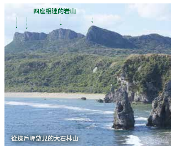
從邊戶岬望見的大石林山

坐落於名為「安須杜」的四座相連岩山中的大石林山，從山頂能眺望遠處水平線上的與論島和沖永良部島。反之亦然，從遙遠的彼方也能望見這座雄偉的大岩山，它也成為人們漂洋過海前往新天地時的路標。