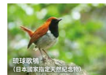
琉球歌鴿 (日本國家指定天然紀念物)

至今安須杜仍然擁有超過 40 個祭拜所。在 17 世紀所編纂的琉球最早史書《中山世鑑》中記載道，這裡是祖神 Amamikiyo (阿摩美久) 最早開創的聖地。另外，12 到 17 世紀琉球王府編輯的沖繩最古老的歌謠集《Omorosoushi (思草紙)》中唱道，依照國王的命令，安須杜的泉水被用作祈求王室長壽的“若水”(元旦早晨汲取的水)。森林中還遺留著許多被認為是野豬牆和家畜圍欄的石造物體。另外，山腳下還有繩文時代到彌生時代之間的村落遺跡「宇佐濱遺跡」，據此推測，早在史前人們就已輾轉來到此地並生活下來。